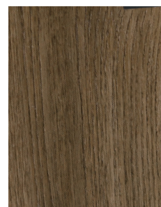
PF004 Prestige Wood