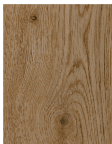
PF002 Happy Wood