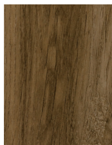
PF003 Urban Wood