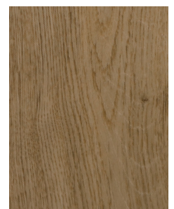
PF005 Wood Story